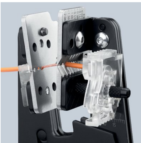
Afstripten met de richting van de kabel mee dankzij precieze mesprofielen

Kapton® is een geregistreerd handelsmerk van E. I. du Pont de Nemours and Company Radox® is een geregistreerd handelsmerk van Huber & Suhner AG