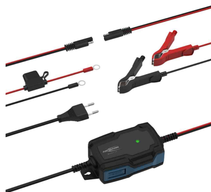
Chargeur de batterie pour voiture BC, avec contenu de la livraison