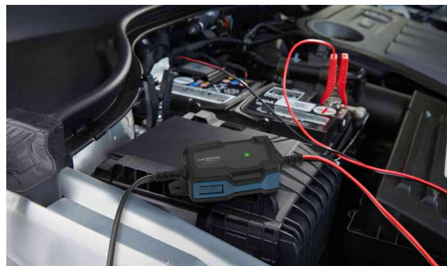
Visuel de référence : montre le produit en utilisation