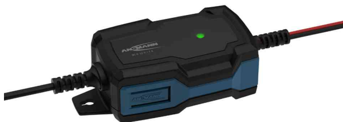
Chargeur de batterie pour voiture BC