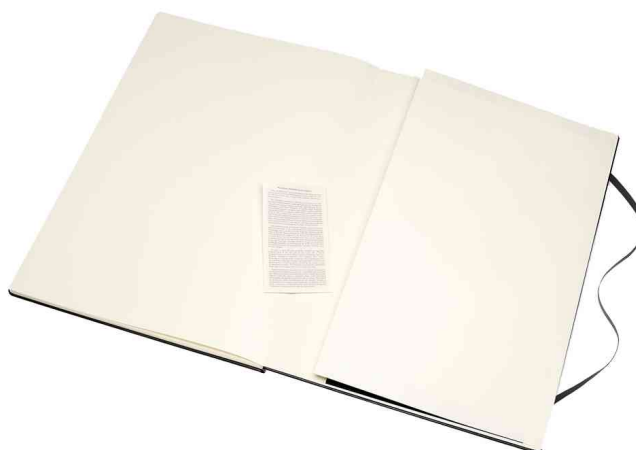
Visuel de référence : vue intérieure avec poche intérieure extensible