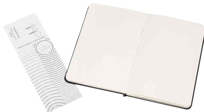
Visuel de référence : vue intérieure avec bandeau