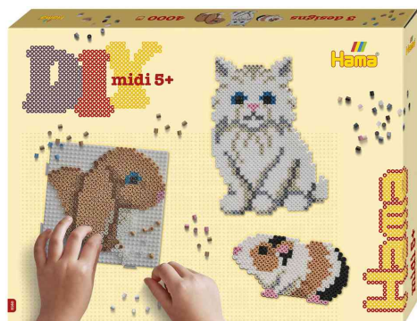
Perles à repasser midi "animaux de compagnie", coffret cadeau

ATTENTION : ne convient pas aux enfants de moins de 36 mois en raison des petites pièces qui peuvent être avalées.