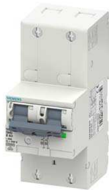
Hauptleitungsschutzschalter (SHU), 2-polig, E 20, 400V