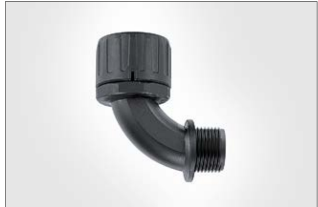
HelaGuard HG-90 90°-Verschraubung mit Außengewinde.

Weitere Verschraubungen mit PG- und drehenden Gewinde auch verfügbar. Für mehr flexible Kabelschutzschläuche und Verschraubungen, siehe den HelaGuard-Katalog.