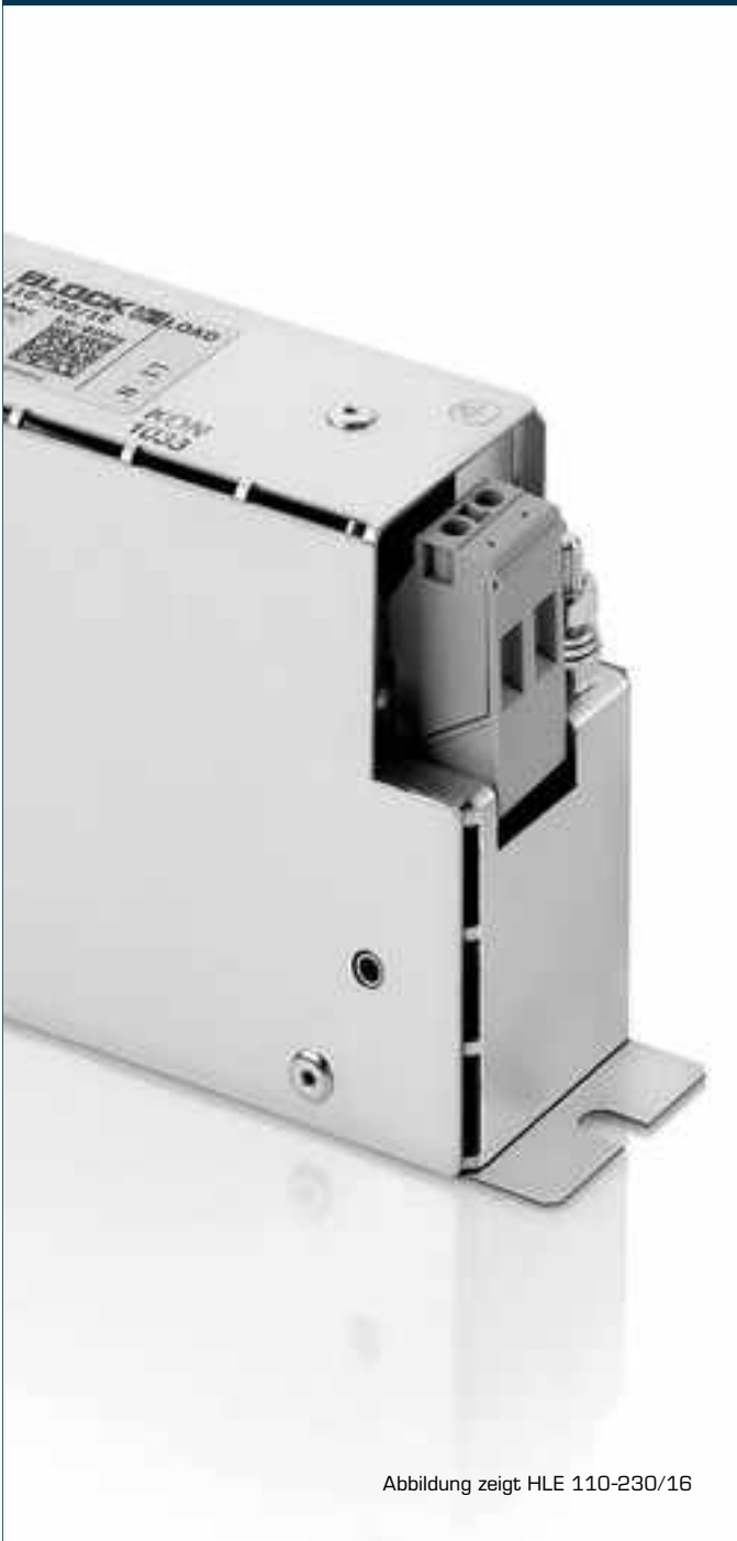
Abbildung zeigt HLE 110-230/16