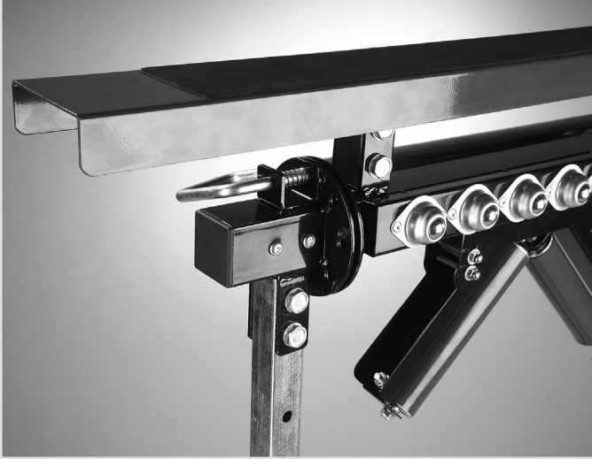
• Feste Auflage