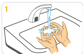
1 Hände mit Wasser anfeuchten.