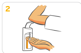
2 1-2 Pumpstöße auf eine Handfläche geben.