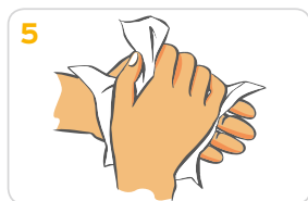
5 Hände gründlich mit einem Wegwerfhandtuch abtrocknen.