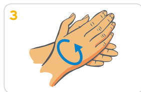
3 Handflächen aneinander reiben, bis sich Schaum bildet. Danach die Hände gründlich waschen.