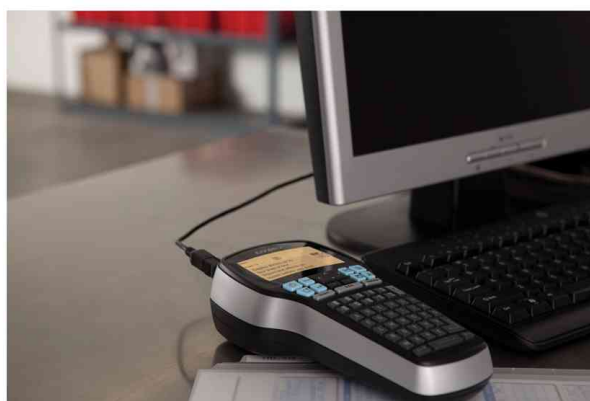
Hand-Beschriftungsgerät "LabelManager 420P"