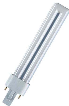
Visuel de référence: Ampoule fluocompacte DULUX® S