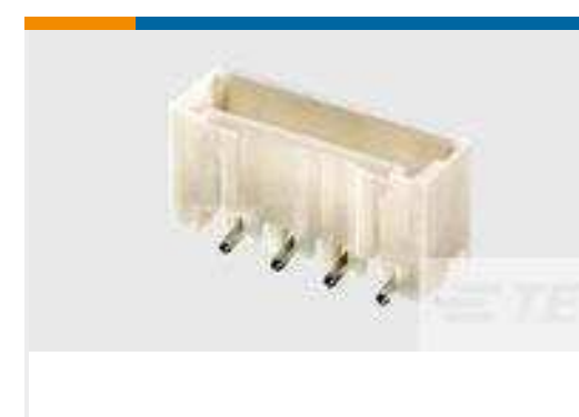
TE Teilnr.:1-292231-2 1.5 MINI CT SGL V SMT W/O BOSS