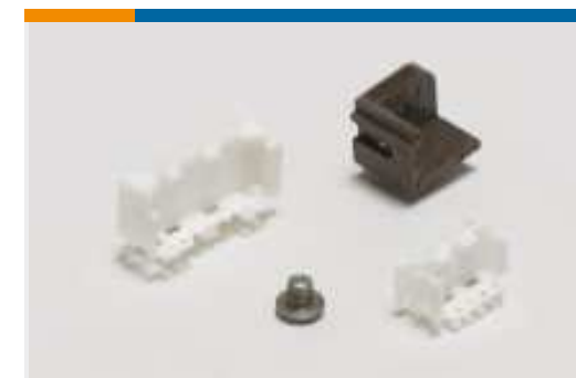
Montage von Leiterplatten- Steckverbindern(46)