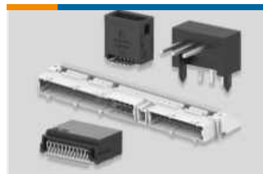
Leiterplattenstiftleisten und -buchsen (756)