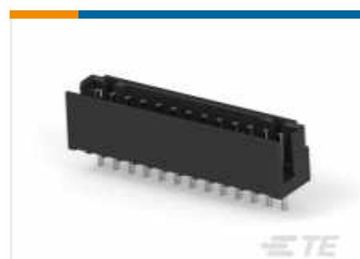
TE Teilnr.:292161-8 CT 2-mm-Pfostenleistsatz: Box-V DIP