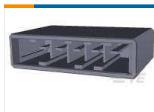
TE Teilnr.:2-316132-3 DYNAMIC D-3200 HDR ASSY 5P V