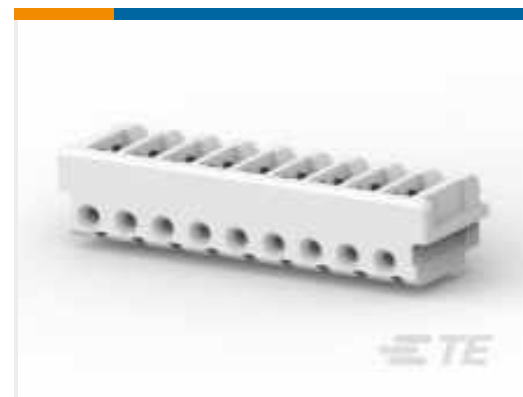
TE Teilnr.: CAT-AM7017-H8172 ALLGEMEINE AMP- ENDVERSCHLUSSGEHÄUSE