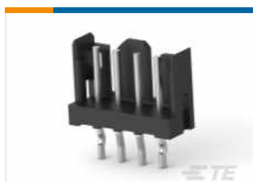
TE Teilnr.:1-292161-5 CT 2mm Post Header Assembly with Kink - Vertical