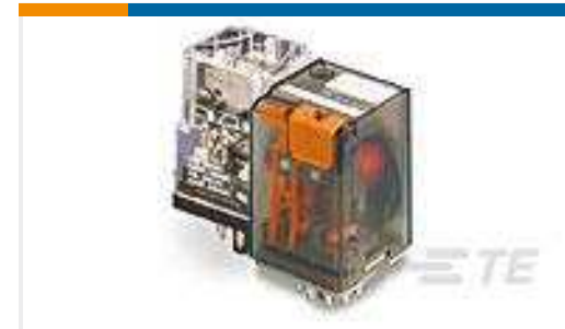
TE Teilnr.:1393105-3 KRPA-5DG-12=KRPA