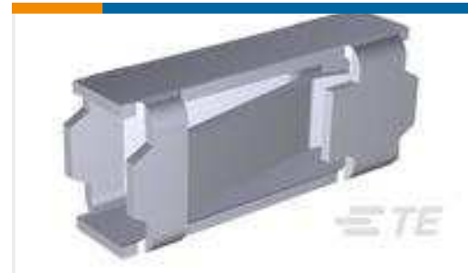
TE Teilnr.:85489-7 MOD I RECP PLTD 30 SEL