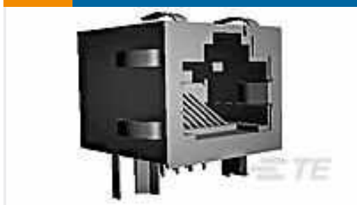
TE Teilnr.:2-1775365-5 MODULAR JACK, RJ45, SHIELD, SMT, 6u" Au