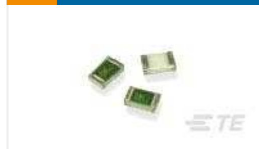
TE Teilnr.:1676693-2 RN 0805 39R2 0.1% 10PPM 1K RL