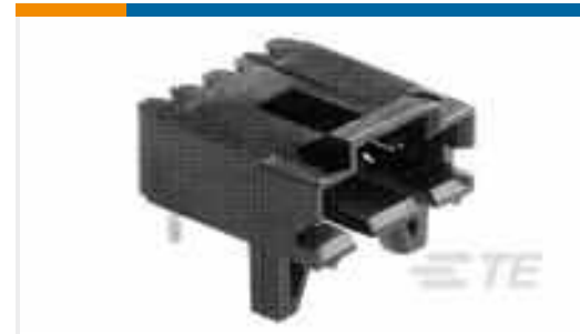
TE Teilnr.:6-103673-9 20 MTE HDR SRRA LATCH W/HLDWN