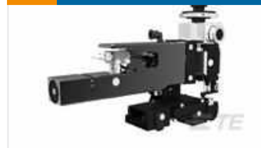
TE Teilnr.:2151029-2 OCEAN_2.0_APPLICATOR-S-278D