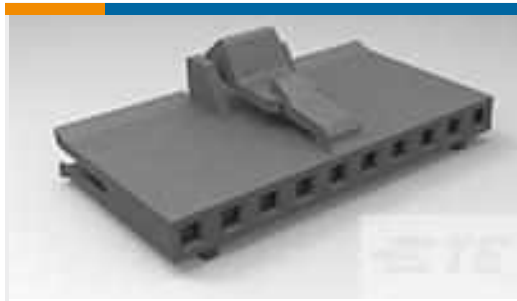
TE Teilnr.:1-487526-9 020 HOUSING FFC RCPT 100CL SR