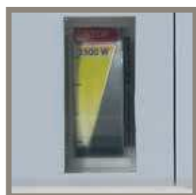
Energieverbrauchsanzeige an der Steckdosenleiste mit thermischer Sicherung gegen Überlastung.