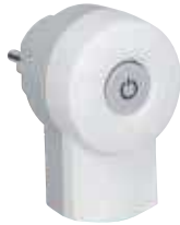
0 504 09