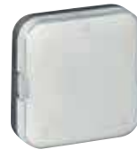
0 506 73