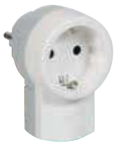
0 504 62