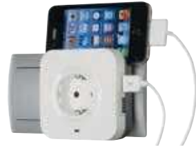
6 946 71