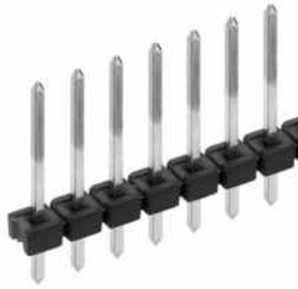
Leiterkartensteckverbinder>Stiftleisten Niedrige Bauhöhe, gerade, □ 0,635 mm