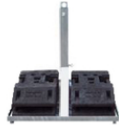
Modellbeispiel: Schilderstände -Typ S- (Art. 35304s)