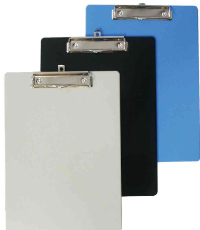
Porte-bloc plastique avec pince, choix des couleurs