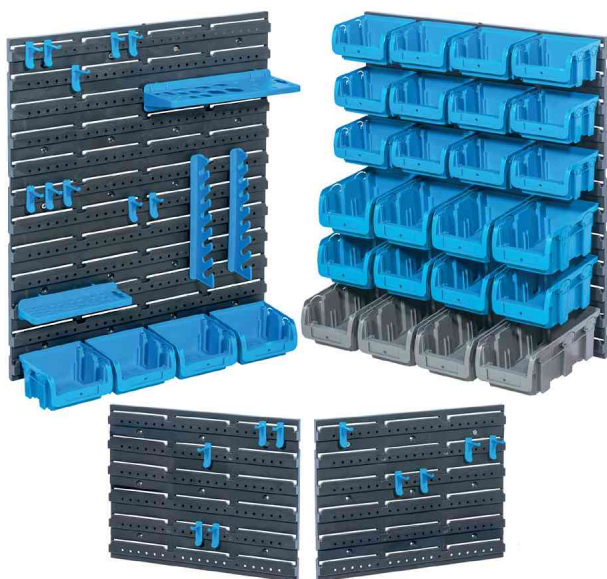
Werkzeughalter-Set "StorePlus >P< 55"