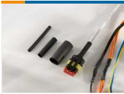
TE Teilnr.:EH2296-000 DWFR-8/2-0-STK