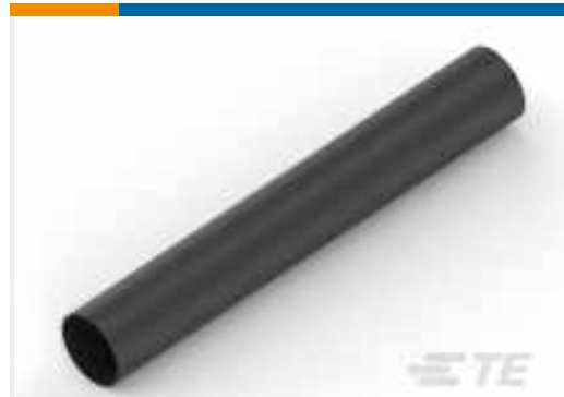
TE Teilnr.:NB11022001 ATUM-4/1-0-STK