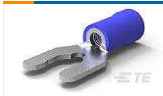
TE Teilnr.:52957-3 TERMINAL,PG SPR SPD 16-14 10