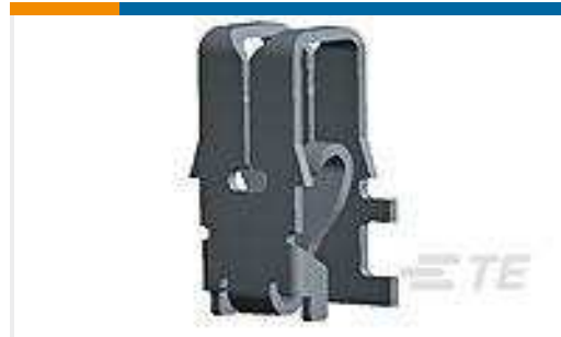
TE Teilnr.:964341-2 MAG MATE KONT. MKII