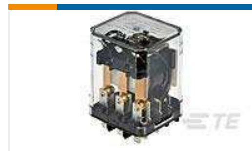
TE Teilnr.:7-1393116-2 KUMP-11D18-24=KU-