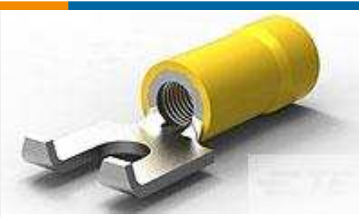
TE Teilnr.:52856-1 TERMINAL,PG SPD FLG 12-10 10