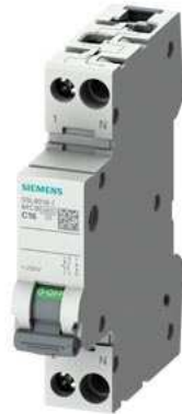
LEITUNGSSCHUTZSCHALTER 230V 6KA, 1+N-POLIG/1TE B16