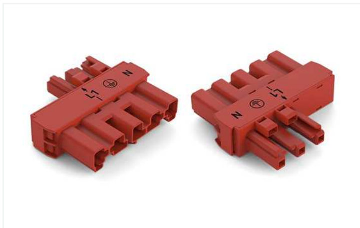
Farbe: ■ rot