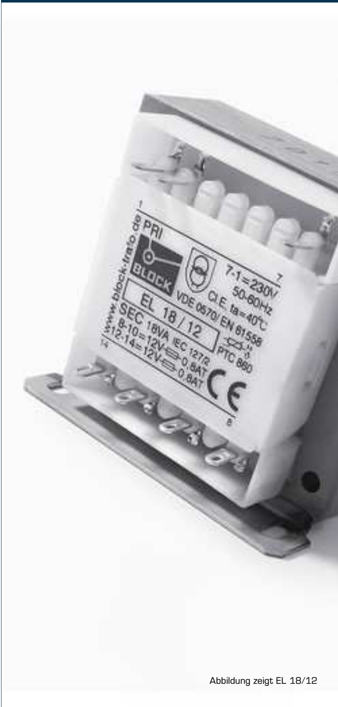
Abbildung zeigt EL 18/12