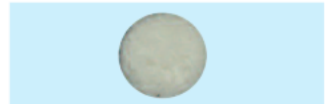
Polierfell Lambswool polishing pad