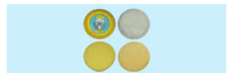
Polier-Set für UT 8763 bestehend aus: Replacement polishing wheels set 1x 75 mm Ø Neopren Klett-Teller 1x 90 mm Ø Lammfell-Polierhaube 1x 90 mm Ø Polierschwamm gelb (hart) 1x 90 mm Ø Polierschwamm beige (weich)