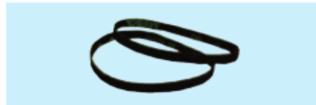
Schleifbänder für UT 8764 A Sanding band for UT 8764 A