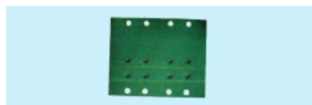
Schleifpapier, Kletthaftung, vorgelocht Velcro sanding paper, pre-punched