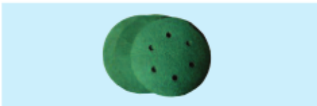
Schleifscheiben, selbstklebend, gelocht (6-Loch) Sanding paper, self adhesive, punched (6 holes)