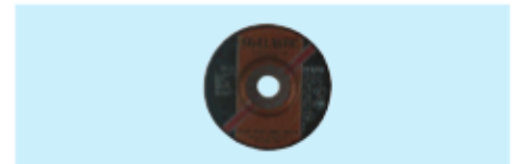
Schruppschleifscheiben Reinforced cutting wheels