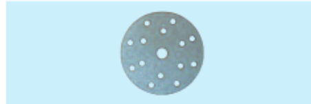
Schleifscheiben für Klettverschluss, gelocht (15-Loch) Velcro sanding paper, punched (15 holes)