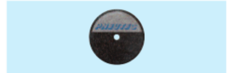
Trennschleifscheiben Cutting wheels