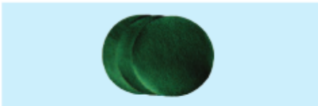
Schleifscheiben für Klettverschluss Velcro sanding paper