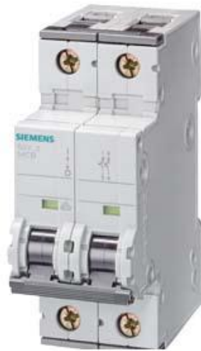
LEITUNGSSCHUTZSCHALTER 400V 10KA, 2-POLIG, A, 2A, T=70MM