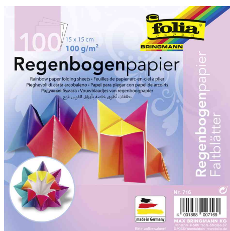
Papier à plier Arc-en-Ciel, 150 x 150 mm