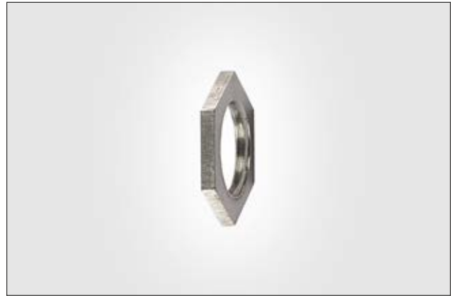
HelaGuard ALS Gegenmutter, verzinkter Stahl.

Die sechskantige ALS Gegenmutter dient als zusätzliche Sicherung der Verschraubung.