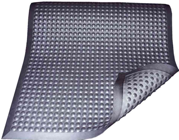
Arbeitsplatzmatte Yoga Ergo Fire