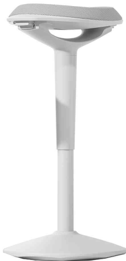
Ergonomischer Sitzhocker ERGO BOOST