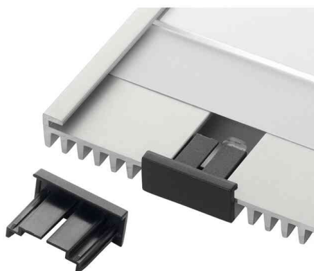
Accessoires: Bouchon INFO SIGN