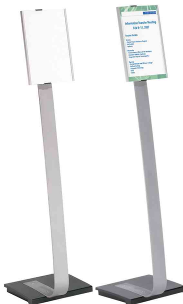
Support d'informations INFO SIGN stand, format portrait