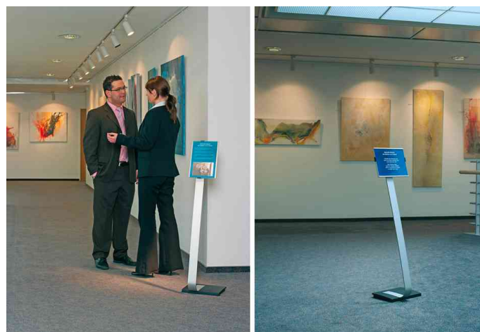
Support d'informations INFO SIGN Stand, exemple d'utilisation