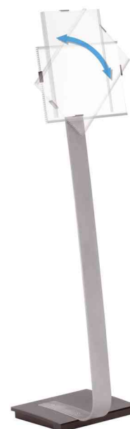
pivotement du format portrait au format paysage