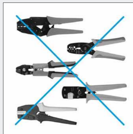
Nur ein Werkzeug für die gängigsten Crimpanwendungen