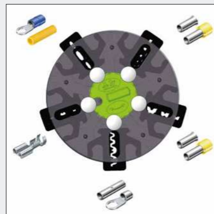
Sichere und geschützte Aufbewahrung der Wechseleinsätze in einem Rundmagazin