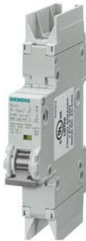
LEITUNGSSCHUTZSCHALTER 10KA, 1-POLIG, C, 25A NACH UL 489 - 277V