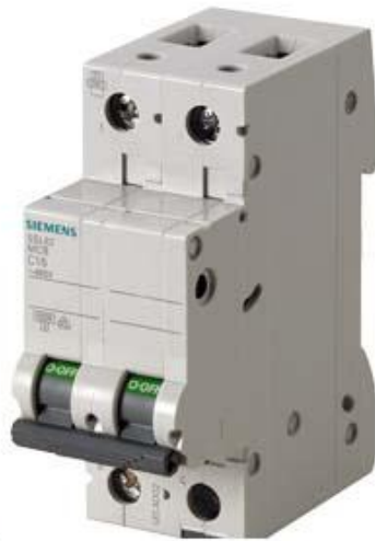
LEITUNGSSCHUTZSCHALTER 400V 6KA, 2-POLIG, B, 13A