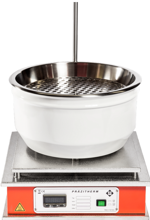
PZ26-4 + LO90 + ST12