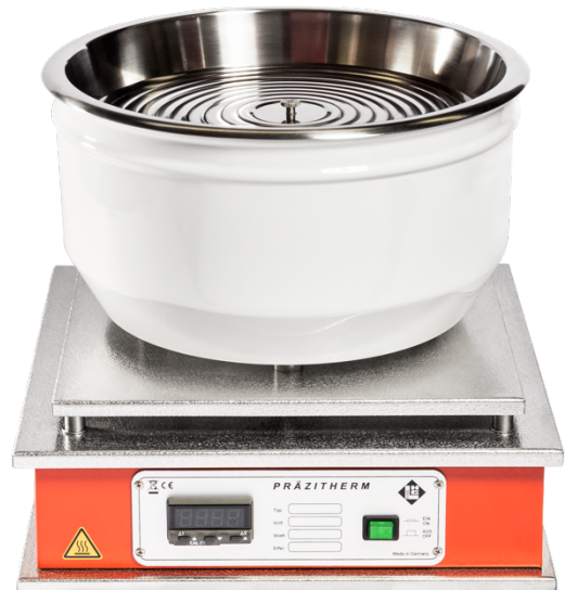
PZ26-7 + RI24/E

Harry Gestigkeit GmbH Angermunder Str. 12 D-40489 Düsseldorf Mail info@gestigkeit.de