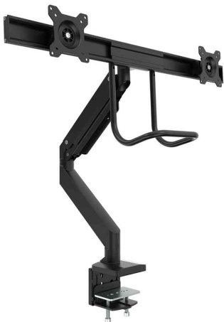
Doppel-Monitorarm Eppa Crossbar, schwarz

- ideal für Schreibtische mit Rückwand / Trennwand