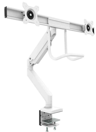
Doppel-Monitorarm Eppa Crossbar, weiß