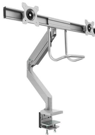
Doppel-Monitorarm Eppa Crossbar, silber