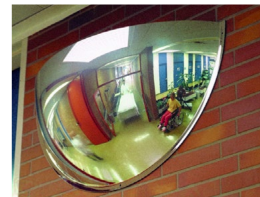
Panoramaspiegel PS 180