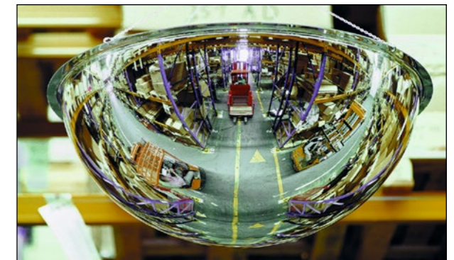
Panoramaspiegel Typ PS 360 zur Deckenmontage. (Kettenset als Zubehör optional lieferbar)