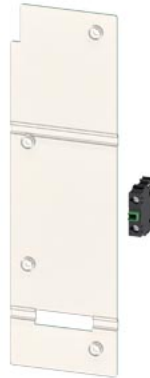
Zubehör für Lasttrennschalter mit Sicherungen Leistenbauform, steckbar, NH00 Hilfsschalter 1S mit Abdeckung