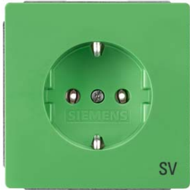
DELTA style grün SCHUKO mit Bedruckung "SV" 68x68mm 10/16A 250V