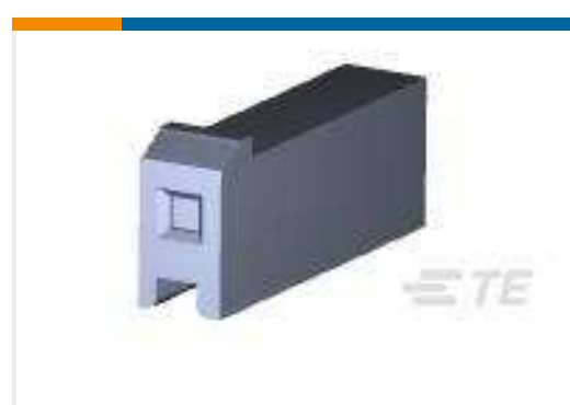
TE Teilnr.:640250-1 01P SL156 HSG W/LCK RAMP NATL