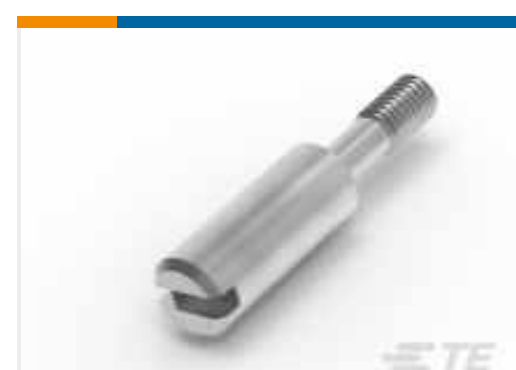
TE Teilnr.:T0931003003-000 CODING-PIN-M3