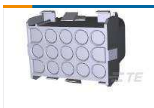
TE Teilnr.:1-480711-9 15P UMNL CAP HSG BLK