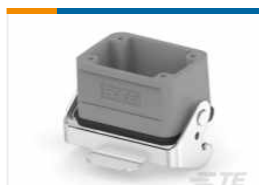
TE Teilnr.:T1730060000-000 H6B-TBF-T