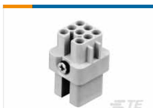
TE Teilnr.:T2020082201-000 HD-008-F