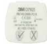
D7925 P2 R