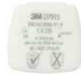
D7915 P1 R