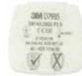
D7935 P3 R