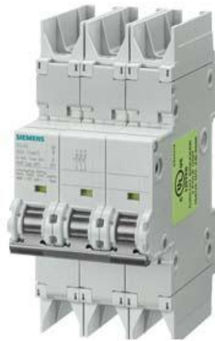
LEITUNGSSCHUTZSCHALTER 10KA, 3POLIG, D, 1.6A NACH UL 489 - 480Y/277V