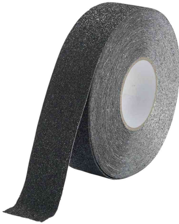
Antirutschband DURALINE® GRIP FORMFIT

- Einsatzgebiete sind Treppenstufen, Rampen, Industrieböden und Trittplätzen an Maschinen und Fahrzeugen