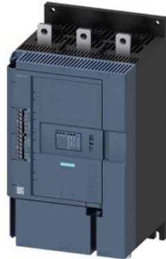
SIRIUS Sanftstarter 200-600 V 315 A, AC/DC 24 V Schraubklemmen Analogausgang