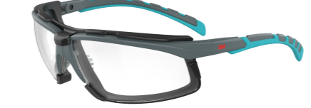
S2001SGAF-BGR-F Scheibe: Klar | Rahmenfarbe : Grau/türkis

Modelle mit Lesebrillenfunktion sowie Brillen mit IR-Schutzstufe werden voraussichtlich Anfang 2020 erhältlich sein Drei Lesebrillen +1,5, +2, +2,5 sowie drei Schutzbrillen in den IR-Schutzstufen IR 1,7, IR 3 und IR 5