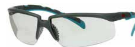
S2007SGAF-BGR Scheibe: Innen/Aussen grau | Rahmenfarbe: Grau/türkis