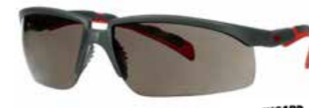
S2002SGAF-RED Scheibe: Grau | Rahmenfarbe: Grau/rot