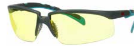
S2003SGAF-BGR Scheibe: Gelb | Rahmenfarbe : Grau/türkis