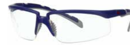
S2001AF-BLU Scheibe: Klar | Rahmenfarbe : Blau/grau