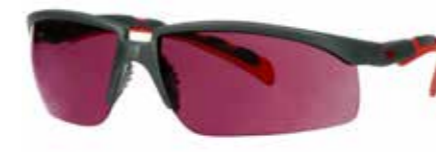
S2024AS-RED Scheibe: Rot verspiegelt | Rahmenfarbe : Grau/rot