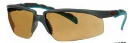
S2005SGAF-BGR Scheibe: Braun | Rahmenfarbe: Grau/türkis