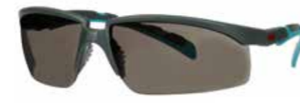
S2002SGAF-BGR Scheibe: Grau | Rahmenfarbe: Grau/türkis