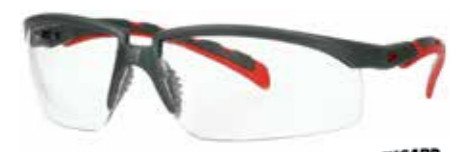
S2001SGAF-RED Scheibe: Klar | Rahmenfarbe : Grau/rot