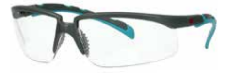
S2001SGAF-BGR Scheibe: Klar | Rahmenfarbe : Grau/türkis