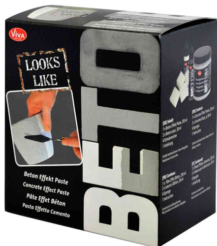
Kit créatif "Décoration tendance effet béton", 8 pièces