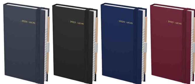
Visuel de référence: Agenda journalier Chantier, aperçu des couleurs