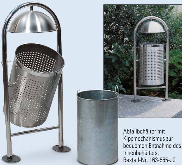
Abfallbehälter mit Kippmechanismus zur bequemen Entnahme des Innenbehälters, Bestell-Nr. 163-565-J0