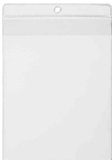
Visuel de référence: Pochette transparente à suspendre