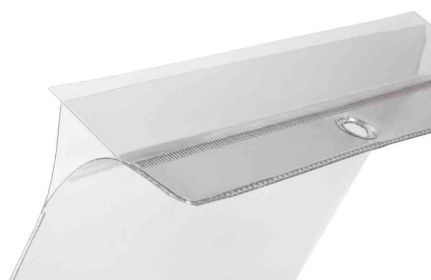
Avec clapet de protection