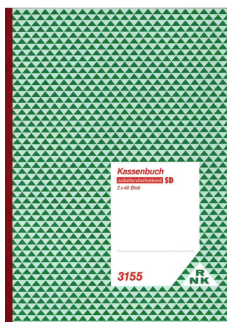
Kassenbuch DIN A4, mit Umsatzsteuererfassung