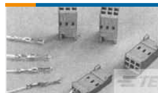
TE Teilenummer 188744-1 CONTACT REC HE14 COSI TIN PLATED