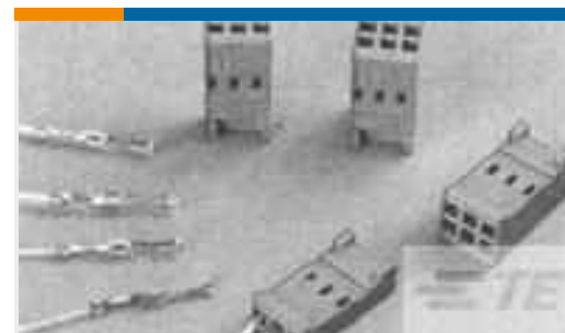
TE Teilenummer281838-6 HOUSING HE13 HE14 COSI 6 P