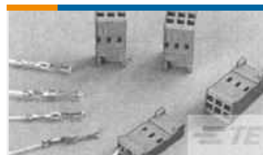
TE Teilenummer188744-1 CONTACT REC HE14 COSI TIN PLATED