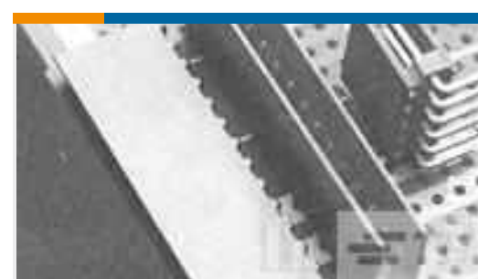
TE Teilenummer281695-8 HEADER HE14 STRAIGHT 8 P