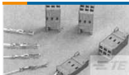
TE Teilenummer281838-8 HOUSING HE13 HE14 COSI 8 P