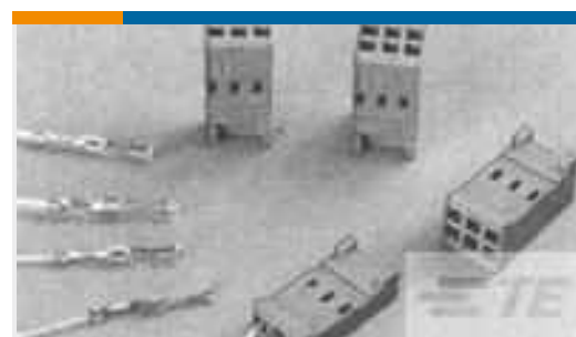
TE Teilenummer 182734-3 CONTACT REC HE13 COSI LOOSE PIECE